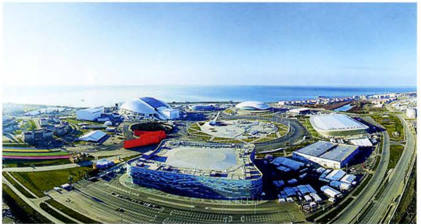
Олимпийские сооружения в Сочи